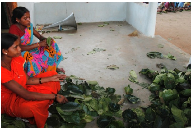
दोने, पत्तल बनाने की कला घोटल में सीखी जाती है

इन गाँवों के आदिवासी काफी प्रेममय और शर्मीले रूप से बाहर के मेहमानों का आदर-सत्कार करते हैं. यहाँ के लोग बहुत धीमी आवाज़ में बोलते हैं. केवल जानवरों को इकट्ठा करते समय, या फिर दूर से किसी को बुलाते समय ही वो जोर से चिल्लाते हैं. बड़े लोग, बच्चों के साथ बहुत इज्जत से पेश आते हैं और उनके व्यक्तित्व का आदर करते हैं. बच्चों और उनके पालकों में अक्सर बराबरी के सम्बन्ध होते हैं. आदिवासी बच्चों की परवरिश परिवार और समुदाय द्वारा, एक सहयोग के माहौल में होती है.